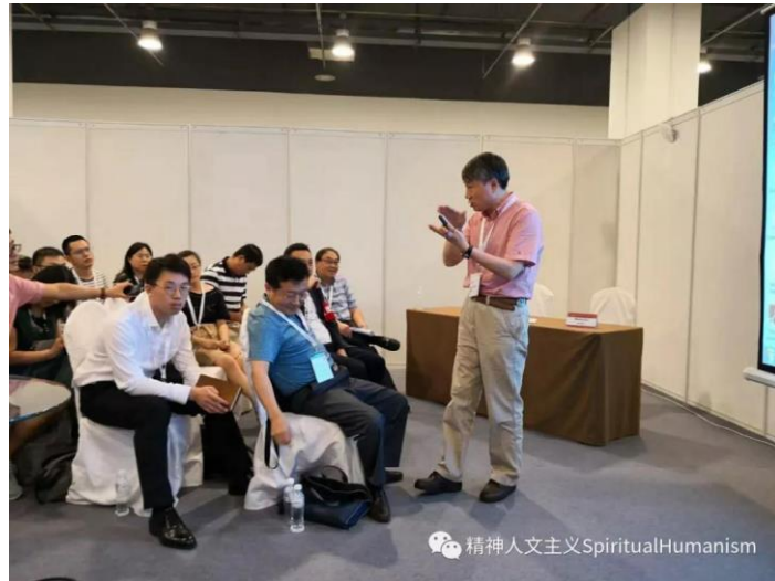
东南大学的樊和平教授就儒家伦理发表精彩演讲

本届大会对青年学生特别照顾，提供了部分住宿和午餐，让他们也获得了表达自己学术观点的宝贵机会。组委会还组织提供了大量的交通服务、信息服务。近百辆大巴车穿梭在作为主会场的国家会议中心和各个主要宾馆之间。千余名学生志愿者在交通安排、会场幻灯片演示、翻译、信息引导等各个方面默默无闻地努力工作。值得一提的是，组委会提供的咖啡茶水矿泉水非常足量，并且提供免费的打印服务。