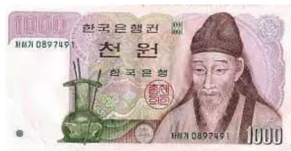
1000 韩元背面是朝鲜王朝大儒李滉退溪先生

过去30年亚洲价值在国际社会引起了热烈讨论，亚洲价值以儒家伦理为主，显示在今天日本和四小龙（南韩，台湾，香港，新加坡）的政治文化中儒家价值具有强大的生命力和说服力。儒家价值也是广义文化中国的核心价值。我以为儒家的仁义礼智信都是普世价值，而且可以和现代西方启蒙所孕育的普世价值，如理性、自由、法治，人权，人的尊严进行平等互惠的对话。 没有同情的理性会成为冷酷的算计；没有公义的自由会成为自私自利；没有礼仪的法律会成为无情的控制；没有责任的权力会成为掠夺的借口；没有社会和谐，个人的尊严就会孤立无援。 相反，同情而无理性会成为溺爱；公义而无自由会成为强制；礼仪而无法律会导致腐化；责任而无权利会成为压迫；社会和谐而无个人尊严会成为控制的手段。其实，核心价值之间是有张力，有冲突甚至矛盾的。西方哲学在处理自由与平等如何优质配置不知用尽多少心血。在儒家传统中，仁和礼之间的紧张比比皆是。价值优先的讨论当然更是众说纷纭。