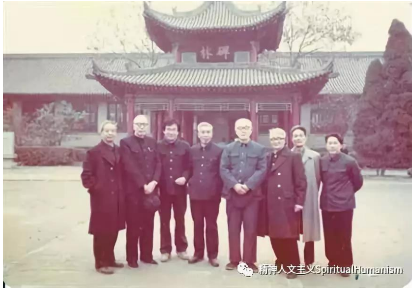
杜维明先生 1983 年游学西安

“天不生仲尼,万古如长夜”,也就是说他是一道明亮的光芒,使得在中华大地所发展出来的各种不同的、伟大的文化建树,都能够朗然,不只是一个混沌沌的情况。对人生的价值、人生的意义,人类文明的发展,以及中华民族能够在世界上提供什么样的资源,能够为人类做出什么样的贡献,这些课题形成了中国民族的基因(DNA),这是一种说法。