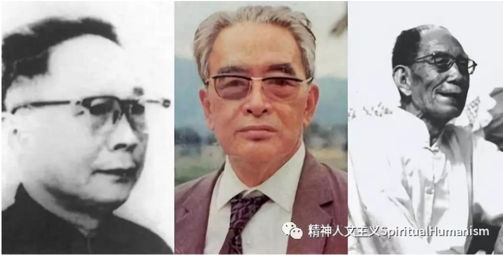
杜维明先生的老师们：徐复观先生，唐君毅先生和牟宗三先生（从左到右）

因此，一个精神性的人文思想，包括个人，通过个人的一己之学，体现孟子所谓“先立乎其大者”，人是大体，不仅是小体，而是能够体现一个人能够和天地万物形成一体的基本精神。