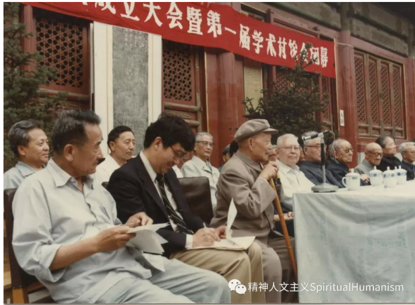
杜维明先生（左二）与梁漱溟先生（右三）在北京，右二为张申府先生。

其实，现在意义上的国学是具有中国特点的，而这个具有中国特点的学问又有区域的价值，包括受到中国文化圈影响的东亚各个地方，乃至东南亚，也有全球的意义，这是一个国际性的学问，不仅是一个地方性的学问，是一个有地方价值，而有全球意义的学问，是人类文明共同发展的一个特殊方向。