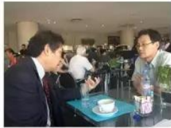
韩国学者聆听杜维明先生