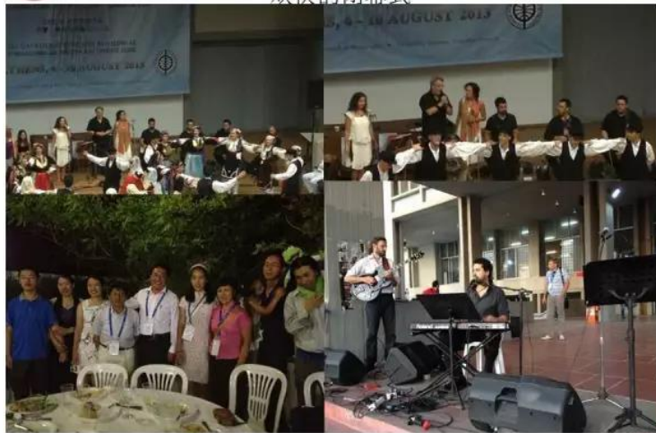
(雅典哲学大会闭幕式庆祝 Party，爱琴海之夜)

哲学不仅仅是理性思辨、自我反思，追求真理和意义的学问，也是学做人的学问。“学以成人”是理论和实践的结合，是认知，也是行为。个人不是孤立的个体，是一个网络的中心点，也是另一个中心点的组成部分。学做人，必然牵涉到它者，如家庭、群体、民族、社会、国家、宇宙。从生物人到文化人、文明人、政治人、经济人、生态人等等，包括各种人物角色的转换，人始终处在转化和被转化，塑造和被塑造的变化过程之中。人在永恒中短暂，人也能在短暂中永恒，人即是哲学。