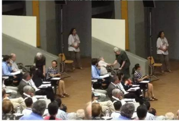
强悍的土耳其女哲学家Ioana Kucuradi教授在辩论时和杜先生等人握手她支持中国承办下一届大会。 她是土耳其知名的哲学家、FISP名誉主席；而上次以人权问题为理由反对伊朗举办的就是Ioana Kucuradi。