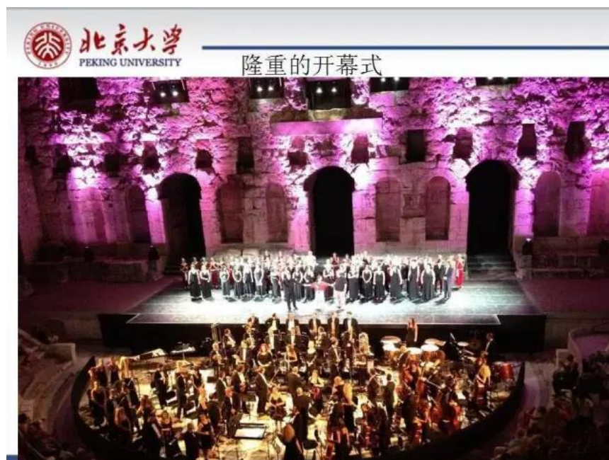
（2013 年第二十三届世界哲学大会在雅典隆重开幕，希腊总理致辞）

第二十四届世界哲学大会的主题是“学以成人”（Learning to be Human），全体大会、专题分会、特约讲座、99 个分组会议，将汇集东西南北各国哲学家，还有各时代的先知、智者、哲人的灵魂相伴，以前所未有广度、深度，多种多样的交流形式，从自我，社会，自然，天道，和传统五个维度对人的过去，现在、未来进行立体的哲学探索。