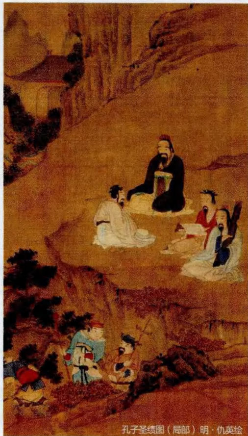
孔子圣迹图（局部）明·仇英绘

20年来，儒家如何在文化多样性的全球趋势中，促进平等互惠的“轴心文明”之间的文明对话，成为我的科研重点。我的终极关怀，“儒学的第三期发展”，必须在这一论域中才能落到实处。